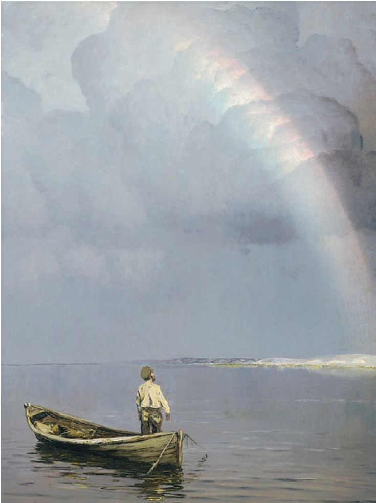
Радуга. Н. Дубовский. XIX в.