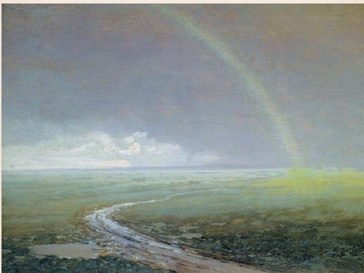
Радуга. Этюд А. Куинджи. 1900-е гг.