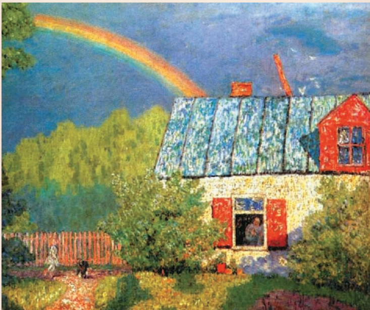
После весеннего дождя. Н. Крымов. 1908 г.