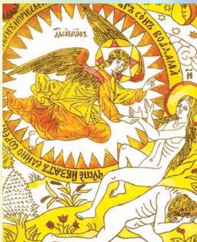
Сотворение Евы. Лубок. XIX в.

Р адуга — не просто поразительное по красоте своей природное явление, но и глубокий символ бытия. В Библии радуга представлена как знамение вечного завета между Богом и человеком. Семь основных цветов радуги положено Богом в основание небесного и земного бытия, оно символизирует семь таинств церкви, семь светильников перед Престолом Божиим в Апокалипсисе. Радуга — это мост между миром горним и миром земным, между жизнью временной и жизнью вечной. Христианская церковь полагает эту связь осуществившейся во Христе. Христос — ходатай за весь мир, и радуга в таком случае — образ сияния славы Христовой. В Откровении апостола Иоанна Богослова есть места, где апостол видит Господа Вседержителя, сидящего на Престоле, вокруг которого — радуга.