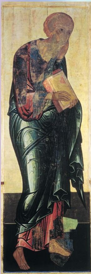
Иоанн Богослов. Деисусный чин Успенского собора во Владимире. 1408 г.

«И сказал Бог: вот знамение завета, который Я поставляю между Мною и между вами и между всякою душою живою, которая с вами, в роды навсегда: Я полагаю радугу Мою в облаке, чтоб она была знамением завета между Мною и между землею. И будет, когда Я наведу облако на землю, то явится радуга в облаке; и Я вспомню завет Мой...»